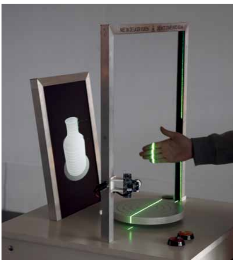
Producción Sistema 3D: Unfold, colectivo belga. Torno virtual.

El 3º grupo: “Producción Cerámica en Sistema 3D” , incorpora la nueva tecnología digital que llega a los talleres de diseñadores y artistas.