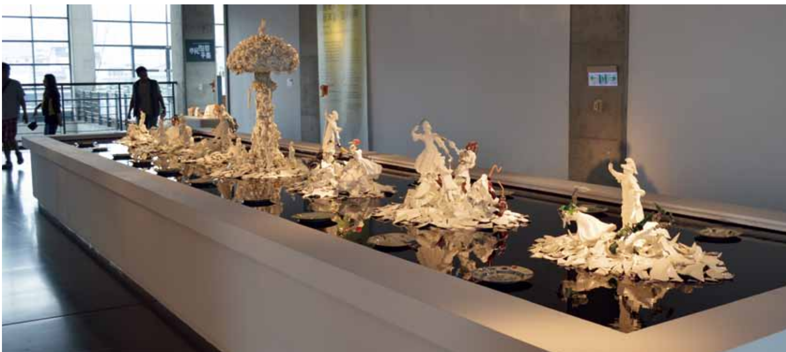
Desechos, Reutilización y Reciclados: Bouke de Vries, Holanda

carteles de “Se Busca”, con foto y descripción de la pieza, hechos con el humor que le es característico.