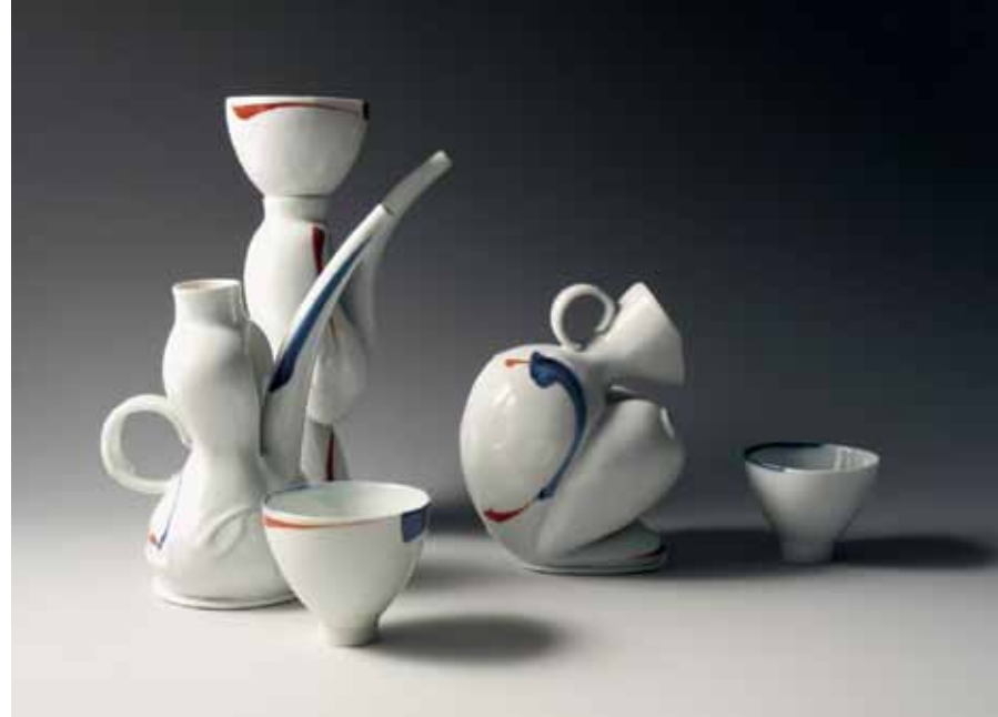
Identidades Globales: Jiang Yanze, China