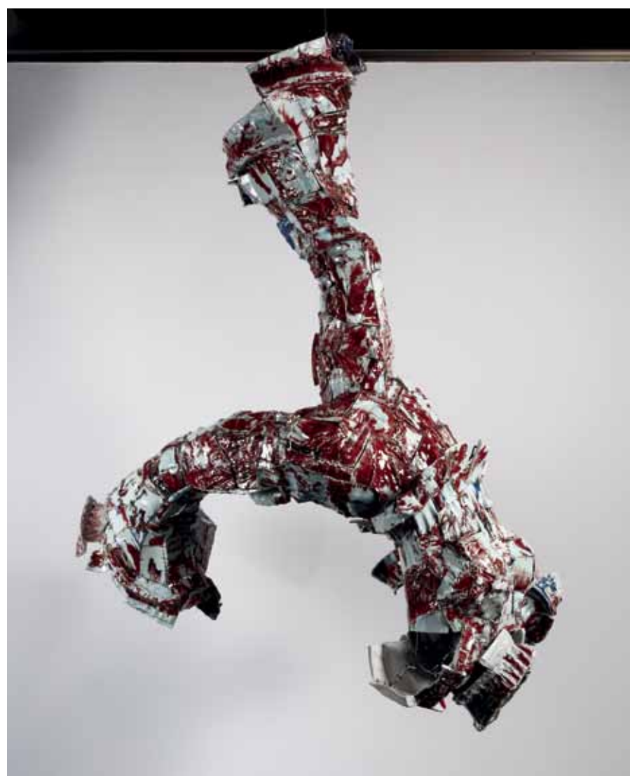
Desechos, Reutilización y Reciclados: Li Xiaofeng, China